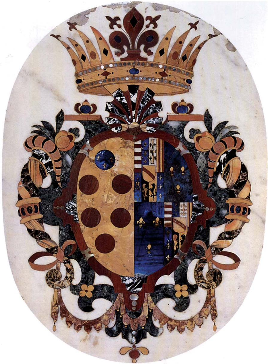
7. Stemma Medici-Lorena 1589 ca., mosaico di pietra, cm 38x29. Firenze, Museo dell'Opificio delle Pietre Dure, im. n. 262. Vedi scheda n. 4364.