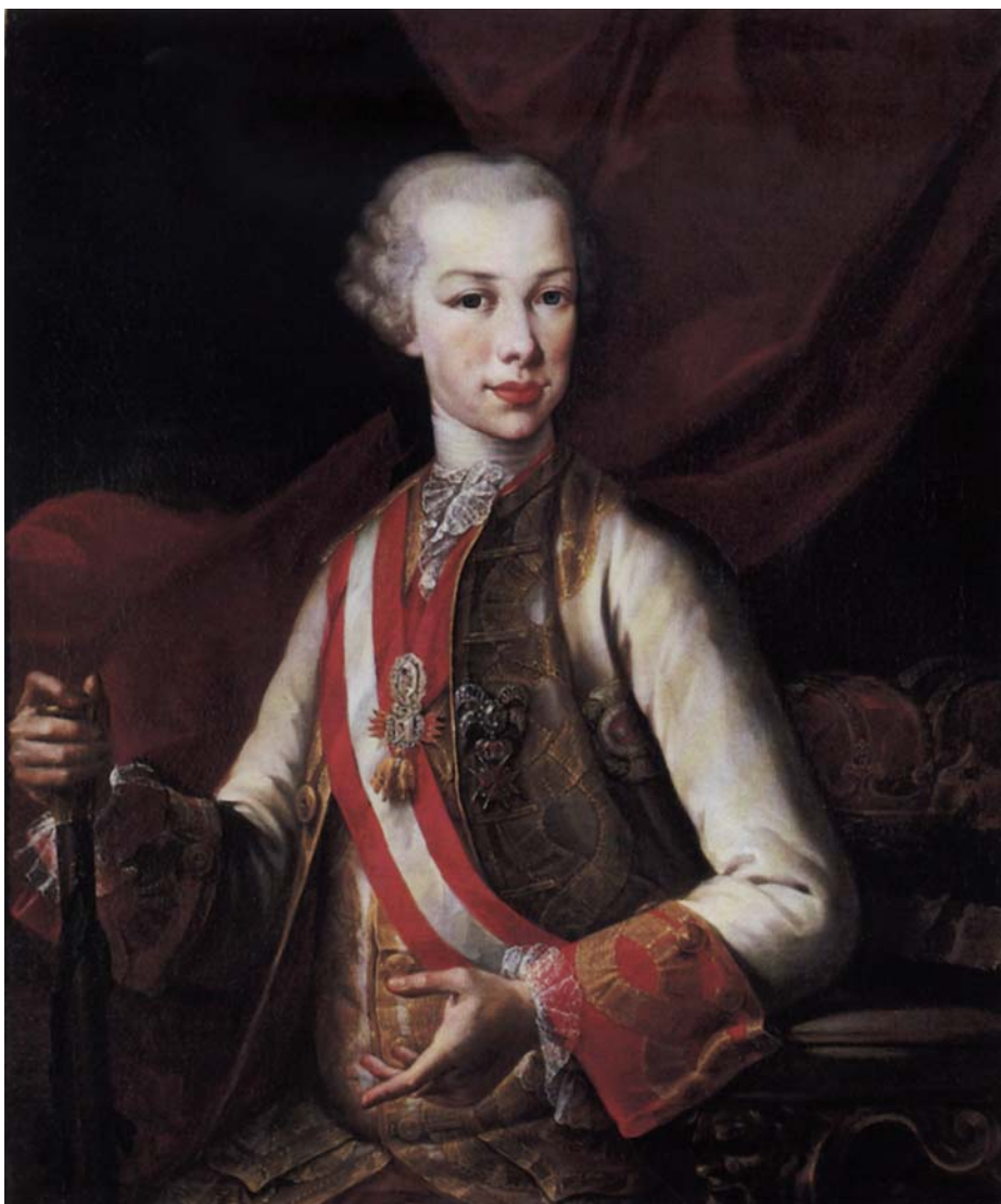
8. Ritratto di Pietro Leopoldo d'Asburgo-Lorena, granduca di Toscana, 1765-1790. Firenze, Soprintendenza archivistica per la Toscana. Vedi schede n. 2619, n. 3009 e n. 3028.