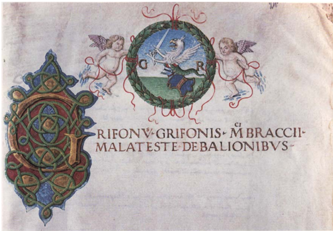
6. Archivio di Stato di Perugia, Archivio storico del Comune di Perugia, Catasti II, 22, c., 135 r. Catasto di Guidi Baglioni . Vedi scheda n. 3817.