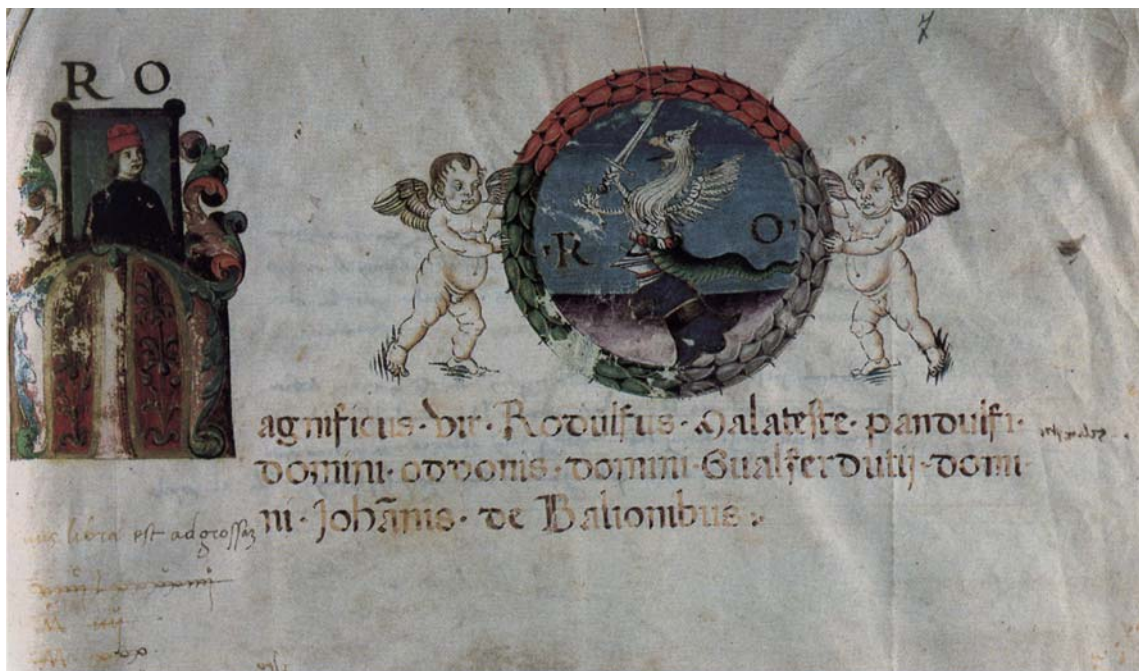
5. Archivio di Stato di Perugia, Archivio storico del Comune di Perugia, Catasti, II, 5, c., 240 r. Decorazione della carta iniziale del catasto di Grifone di Grifone di Braccio di Malatesta Baglioni. Vedi scheda n. 3817.