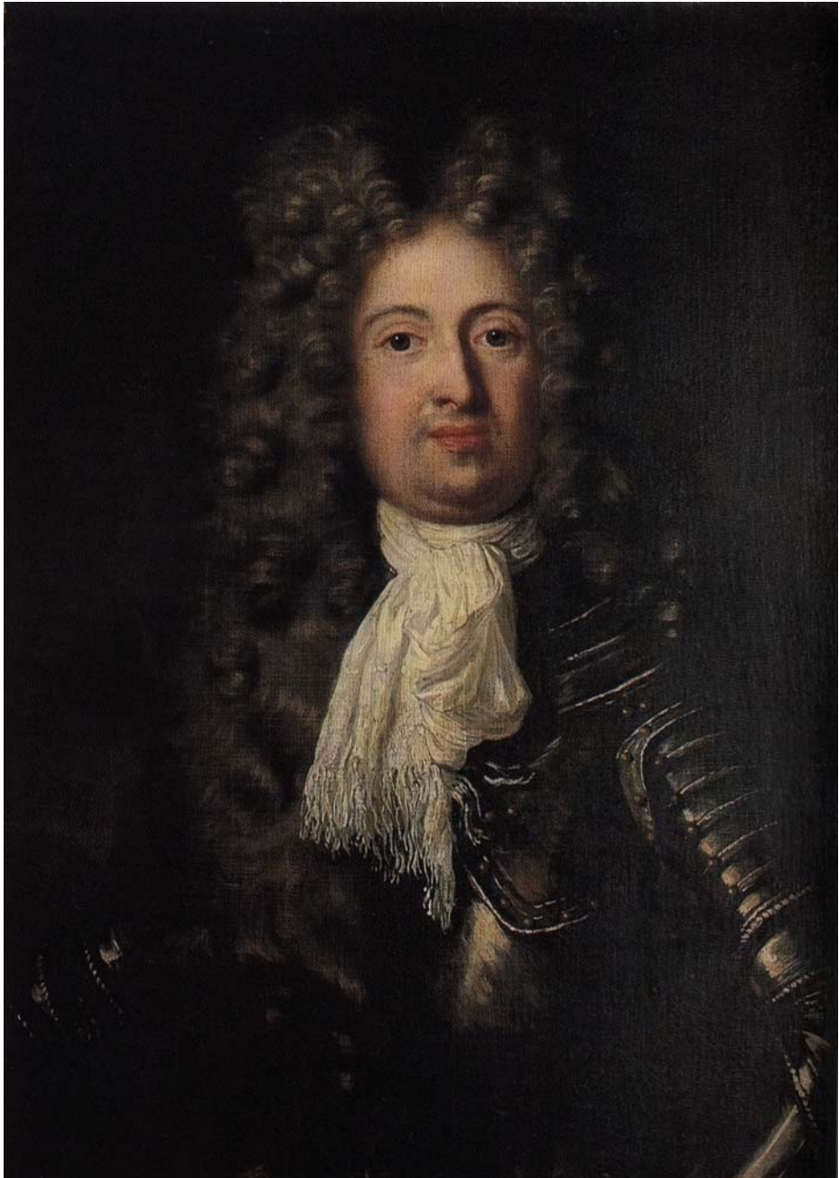
1. Niccolò Cassana, Ritratto del gran principe Ferdinando de' Medici . Firenze, Palazzo Pitti. Vedi scheda n. 2998.