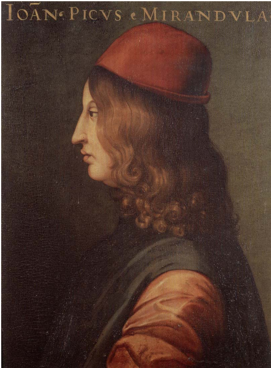
3. Cristoforo Dell'Altissimo, Ritratto di Giovanni Pico della Mirandola , Ante 1558. Firenze, Galleria degli Uffizi. Vedi scheda n. 3864.